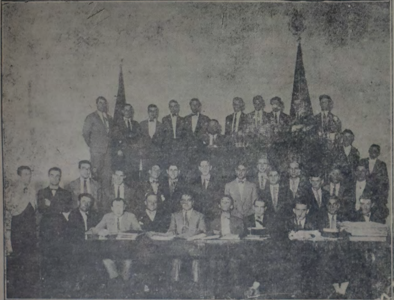
Los delegados y miembros del Consejo directivo, del Comité Ejecutivo y de la Junta Ejecutiva de la Federación local, en pose para LA VANGUARDIA