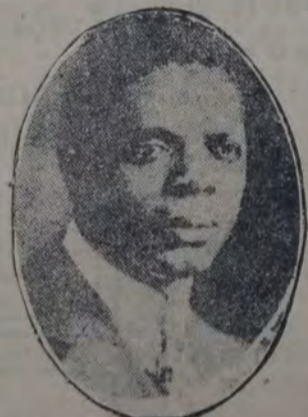
GUILLERMO PICKENS El conocido luchador norteamericano por la igualdad de los derechos de los negros

En el curso de la manifestación se aprobó una resolución saludando al congreso de Bruselas, declarando la opresión colonial una vergüenza para la civilización, y reclamando su desaparición.